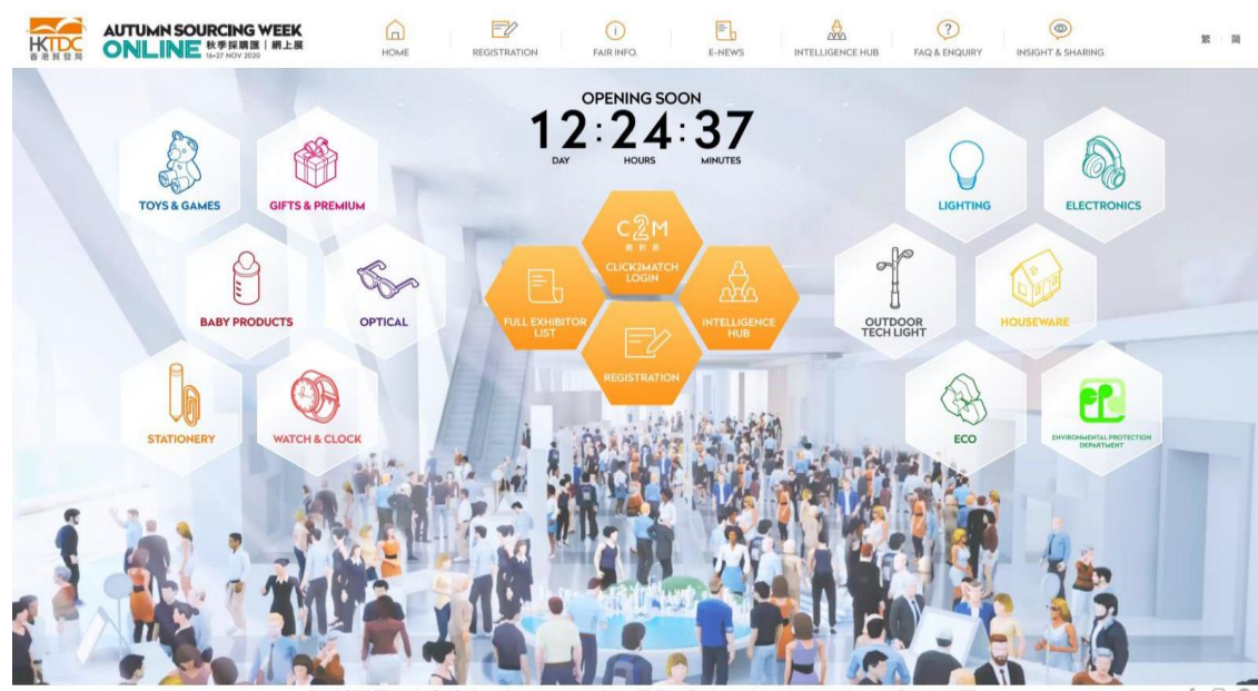
「秋季采购汇 | 网上展」首页