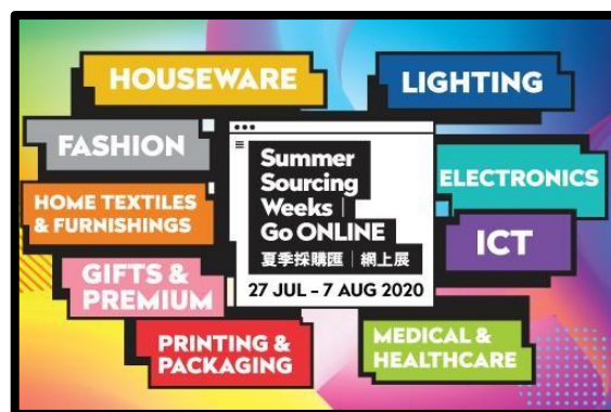
「夏季采购汇 | 网上展」页面